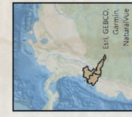
Conflicción Territorial Justicia ambiental y nueva política sobre economías ilegales para la construcción de la paz, en Cauca, Nariño y Putumayo. Documento de Planeta Paz Febrero 2024

PLANETA PAZ Sectores Sociales Populares para la Paz en Colombia